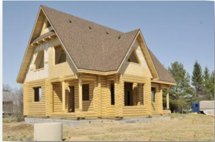
10,6 x 12м «Зимний дом»